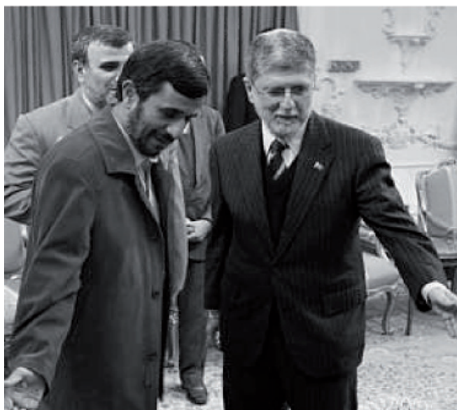
Celso Amorim, Ministro de Relaciones Exteriores de Brasil, en su visita a Irán junto al Presidente Mahmoud Ahmadinejad en Noviembre de 2008

Creemos, por lo tanto, que asistiremos también a un cambio en la estrategia iraní hacia América Latina donde sin abandonar los lazos establecidos con la Venezuela chavista desde Teherán se intentará desarrollar las relaciones con Brasilia como reconocimiento de la importancia regional de Brasil.